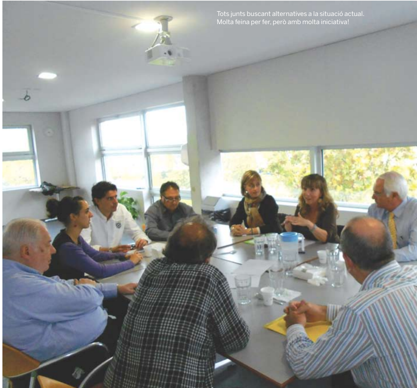
Tots junts buscant alternatives a la situació actual. Molta feina per fer, però amb molta iniciativa!

Los servicios sociales hablan de la comunidad que los sustenta; si sabemos atender las necesidades de las personas más vulnerables, saldremos adelante como país, si las dejamos atrás, todos perderemos.