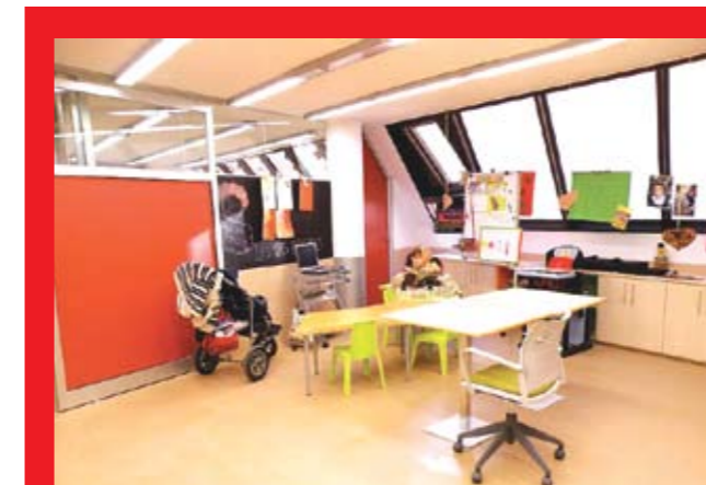
Aula d'educació infantil del centre Esclat.

Para gestionar una crisis tan profunda se deben tener en cuenta todos los agentes que forman parte de la comunidad educativa: profesionales, familias, entidades privadas y, obviamente, el Estado. Afrontar los nuevos retos socioeducativos con una perspectiva restrictiva y de larga duración deberá ser responsabilidad de todos. T