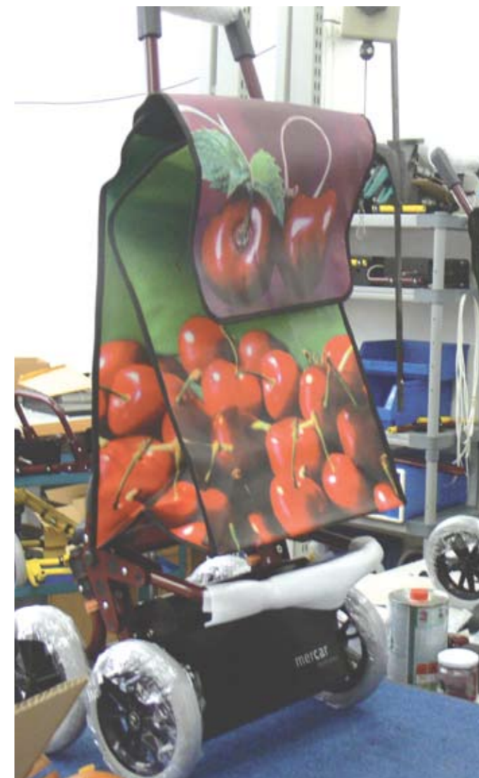
Foto a l'esquerra: Muntatge del carro de la compra. Foto a la dreta: Radiatge de rodes.

Diuen que el futur és dels valents i Esclatec sempre ha estat una aposta valenta; amb la feina feta en tots aquests anys, crec que se'l mereix i se l'ha guanyat amb escreix. T