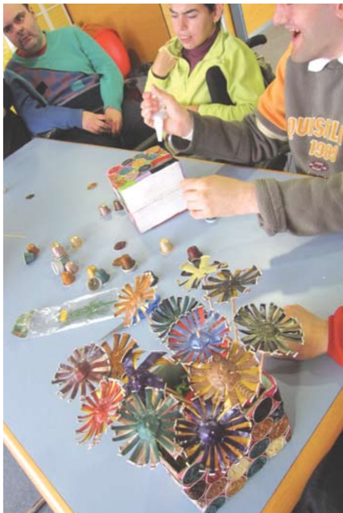
Esclat La Revista