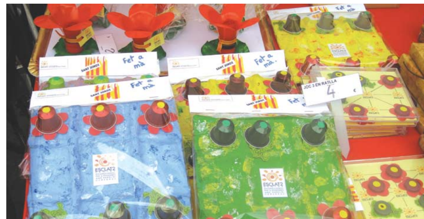
Reciclatge de materials.