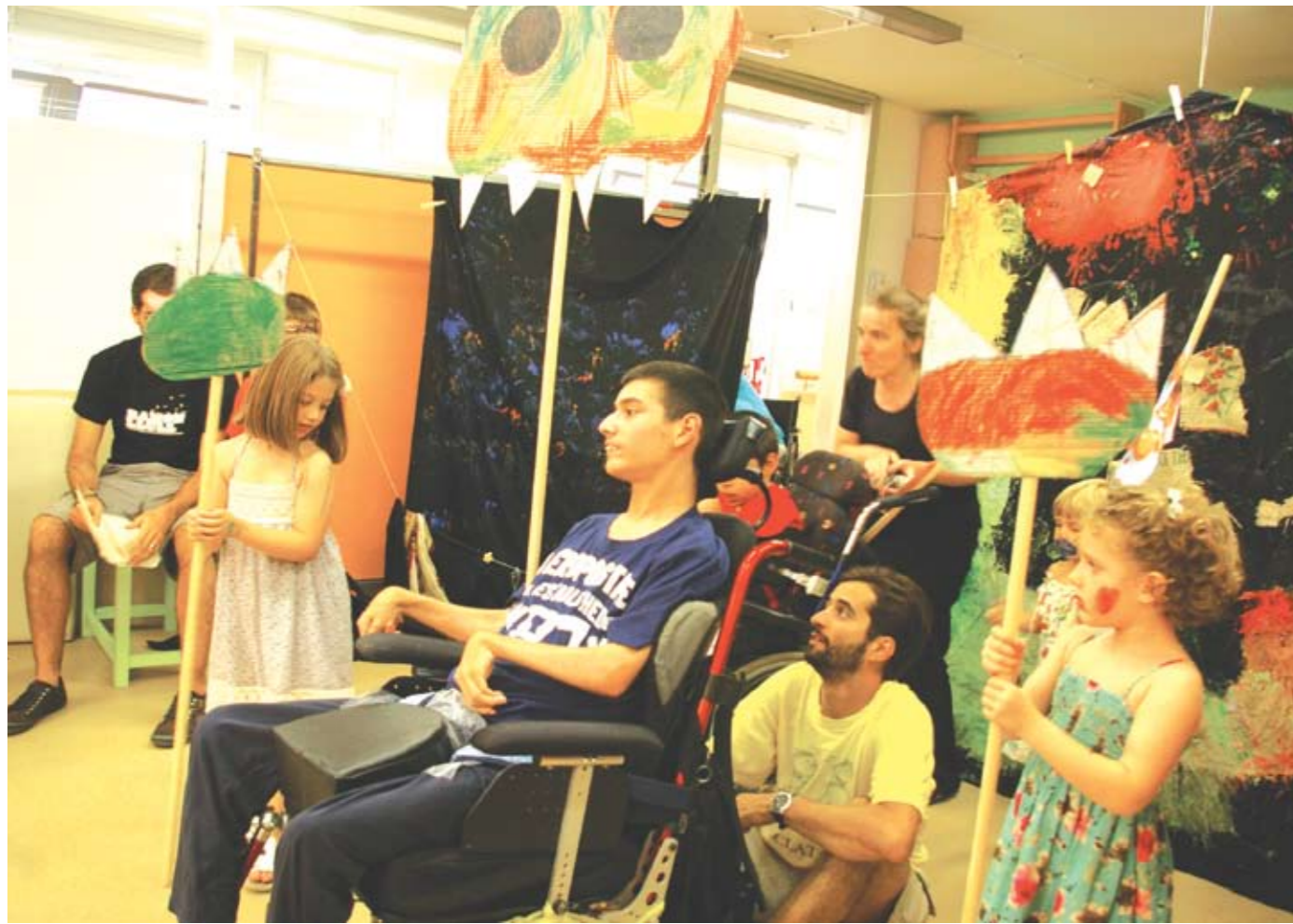
Per una estona, l'escola es va convertir en un teatre infantil.